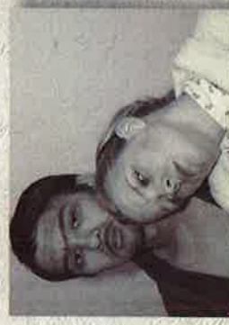
- Wenn ich alt bin, kann ich mich immer noch verlieben.