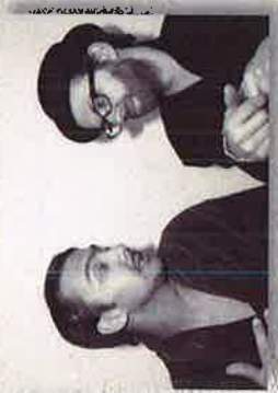
- Wenn ich alt bin, freue ich mich über Menschen, die mir zuhören.