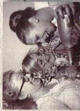
- Wenn ich alt bin, hoffe ich, dass das Gebiss festsetzt wenn ich mich über bestimmte Situationen amüsiere.

Besichtungszeiten: Sonntag nach dem Gottesdienst, Dienstag bis Freitag zwischen 17:00 und 19:00 Uhr Ort: Baden-Baden/Lichtental, Evangelische Lutherkirche, Hauptstr. 51